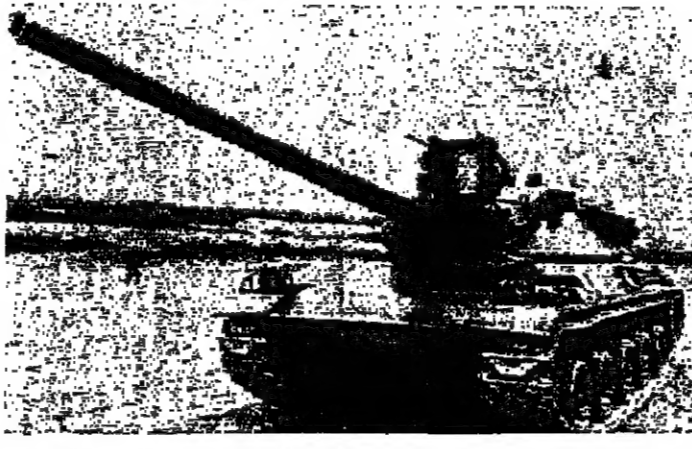
جبهة فرنسية من طراز «أ. أم. أكس» لكر ان مصر مهتمة بالحصول عليها

وخلال الزيارة، أجرى الرئيس السادات اتصالاً هاتفياً مع القاهرة، عن طريق جهاز تلفوني حديث يستخدم الموجات القصيرة. كما زار الرئيس السادات امس، معحف «بوني» في باريس، ووقف اثار الملك لويس الخامس عشر. وفي غضون ذلك قامت السيدة جيهان السادات بزيارة السيدة آن ايون جيسكار ديستان امس، بزيارة مركز تاهيل ذوي المعاهات.